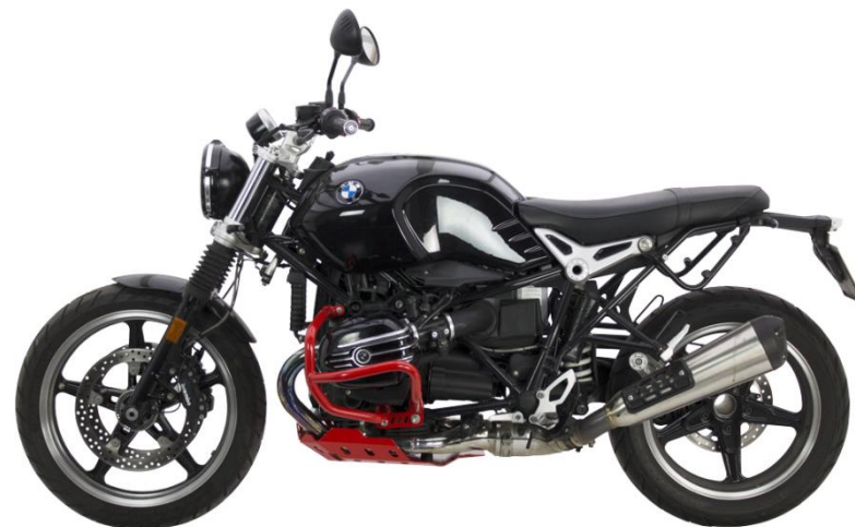
Trail Crash Bar Aluminium BMW R NINE T 2018 Ref: 2AS1970043