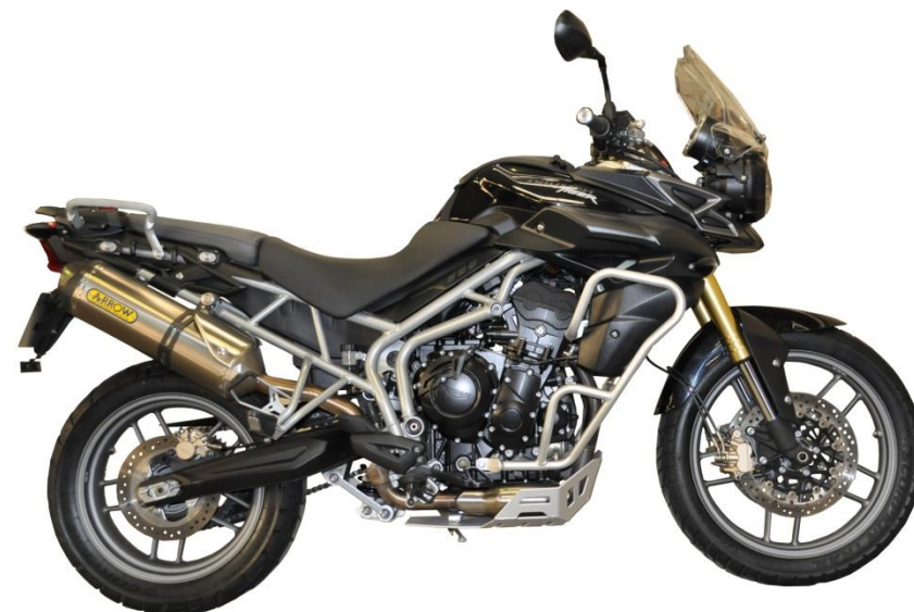
Trail Crash Bar Aluminium TRIUMPH 800-800 XC 2011/14