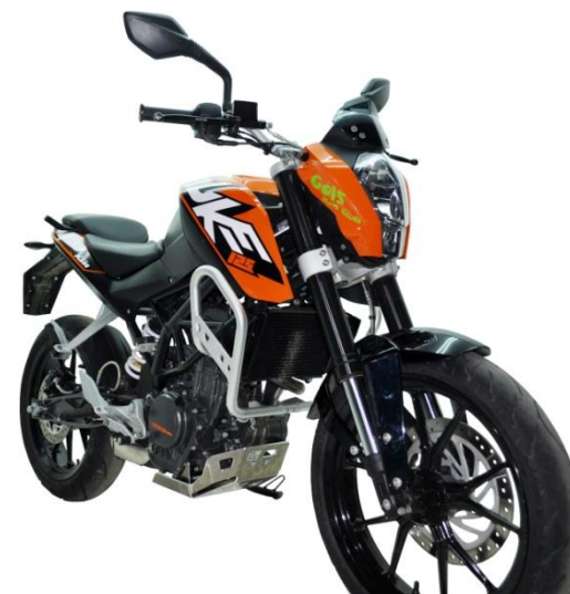
SKID PLATE KTM DUKE 125 2011-2014 KTM DUKE 200 2012-2014 Ref: 2AS0900018