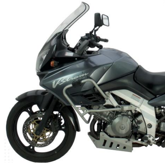
ALUMINUM TRAIL ENGINE GUARD SUZUKI DL 1000 V-STROM 2002-2013 Ref.: 2AS0900006